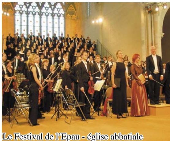
Le Festival de l'Epau - église abbatiale