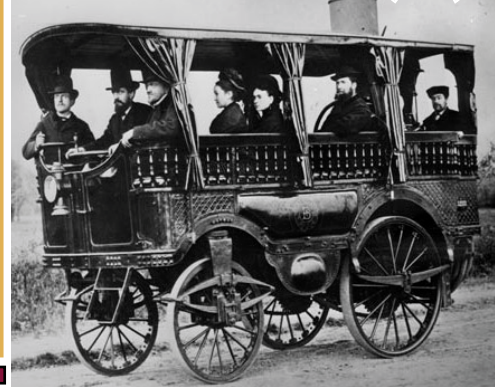
L'Obéissante d'Amédée Bollée (1873)